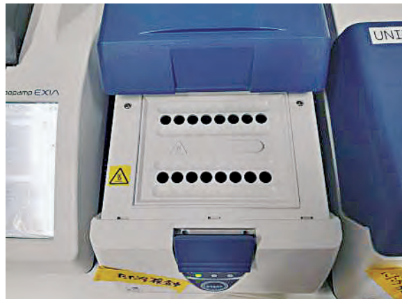
コロナウイルス拡散増幅検査(LAMP法)の風景