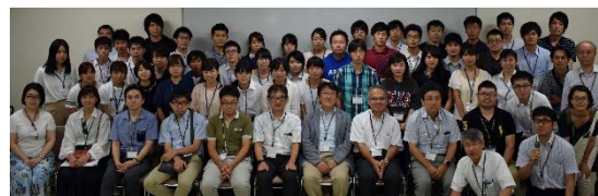
平成29年度夏季地域医療特別実習に於いて