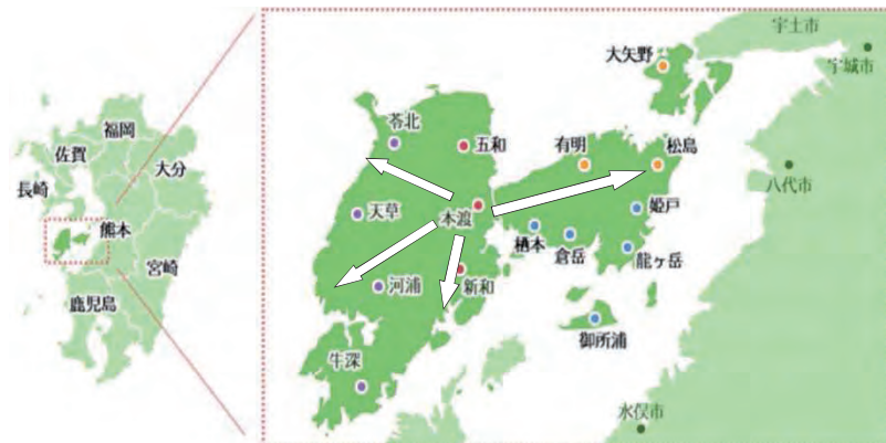
地域医療・総合診療実践学寄附講座及び天草教育拠点の役割/位置付け