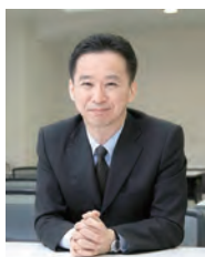
熊本県地域医療支援機構 理事長 熊本大学病院 病院長